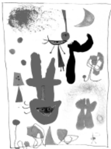
Joan Miró Acrobats in the Night Garden (1948)